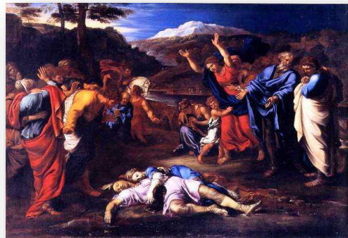
Découverte de Pyrame et Thisbé de Mignard ( 1665)

En étudiant Pyrame et Thisbé d'Ovide, nous pourrons ouvrir cette réflexion par le prisme des notions de pêché de chair et de catharsis, d'attentes du lecteur mais aussi de stratégies littéraires.