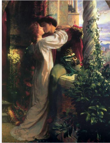
Frank Bernard Dicksee, Roméo and Juliet, 1884