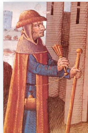
Un lépreux agitant sa crécelle

Nous étudierons la vie de cette léproserie sénonaise au travers de ses règles, de ses finances et de ses occupants.