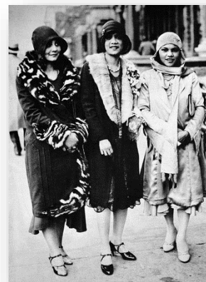
Trois femmes afro-américaines dans Harlem pendant la Renaissance de Harlem en 1925.

Comment renouer avec ses racines, sortir de la ghettoïsation, de la stigmatisation ? Deux mouvements artistiques ont apporté découvertes, richesses et reconnaissance : Harlem Renaissance aux Etats-Unis et la Négritude en France.