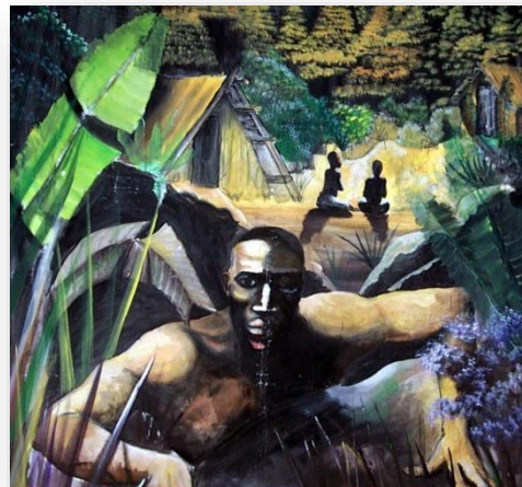
Esclavage à l'île de la Réunion, graff dans la ville de Cilaos

Le marronnage est un mode de résistance que les esclaves noirs et amérindiens adoptèrent pour échapper à toutes les brutalités et aux mauvaises conditions sur les plantations. Ils bravaient tous les dangers pour retrouver leurs familles et leur liberté.