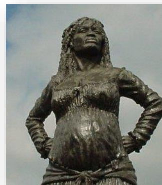
Statue de Solitude, de Jacky Poulrier (1999)

De Solitude en Guadeloupe à Toussaint Louverture , nous étudierons les grandes figures de la révolte. Une nouvelle dimension dans la représentation de l'esclave noir.