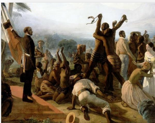
L'abolition de l'esclavage dans les colonies françaises en 1848 de François-Auguste Biard (1849)

Harriet Beecher-Stowe avec La case de l'oncle Tom , La vie de Frédéric Douglass, esclave américain écrite par lui-même, ou encore Douze ans d'esclavage de Solomon Northup font partie des ouvrages américains qui ont participé à l'évolution des mentalités et à l'arrivée de l'abolition de l'esclavage aux États-Unis.