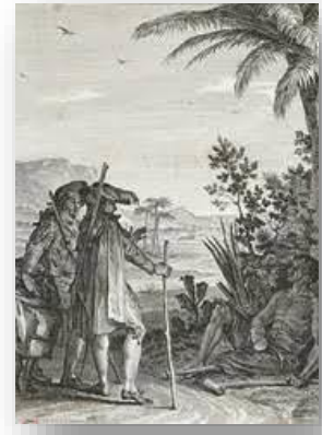
Illustration du chapitre XIX de Candide de Voltaire par Jean-Michel Moreau

Point de départ de la représentation de l'esclave noir dans la littérature, les philosophes des Lumières tels Voltaire , Condorcet et le chevalier de Jaucourt ont voulu s'interroger sur un statut incompréhensible et faire bouger les lignes. Cependant, nous verrons que cette « croisade » eut des limites.