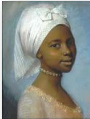
Jean Etienne Liotard, Portrait d'une jeune femme , XVIII e siècle