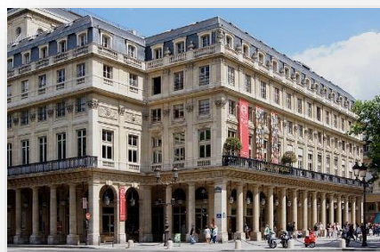
La comédie française