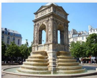
La fontaine des Innocents