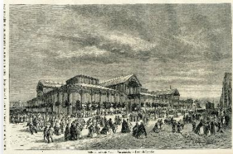
Halles centrales de Paris - Vue générale Dessin de Lancelot reproduit dans Magasin Pittoresque,