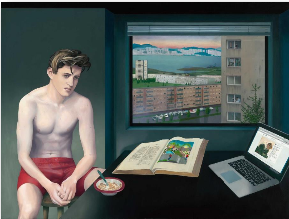
Jean CLARACQ, A View from an Apartment , 2017

De quelles manières les peintres « milléniaux » réinventent-ils les conventions traditionnelles de la représentation du réel ? Comment abordent-ils les préoccupations artistiques et les inquiétudes de leur génération face à la saturation d'images issues d'Internet ? Pourquoi utilisent-ils la photographie numérique ou le modèle vivant pour élaborer une peinture novatrice et cultivée ?