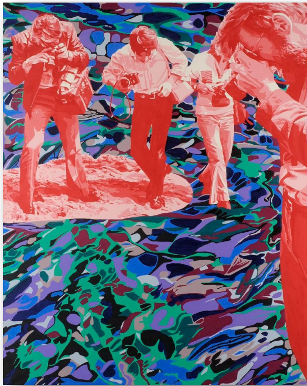
Gérard FROMANGER, Bouge (de la série Question ), 1976

Conçu pour être fluide et inspirant, ce cours traverse mouvements et styles tel un cours d'eau, grâce à une sélection de citations, d'anecdotes et de coups de cœur. De la Nouvelle Figuration aux peintres vivants de la jeune scène française, en passant par les figurations libres des années 80, vous découvrirez comment les artistes figuratifs ont répondu aux défis de leur époque et comment leurs œuvres dialoguent encore et toujours avec notre monde en crise.