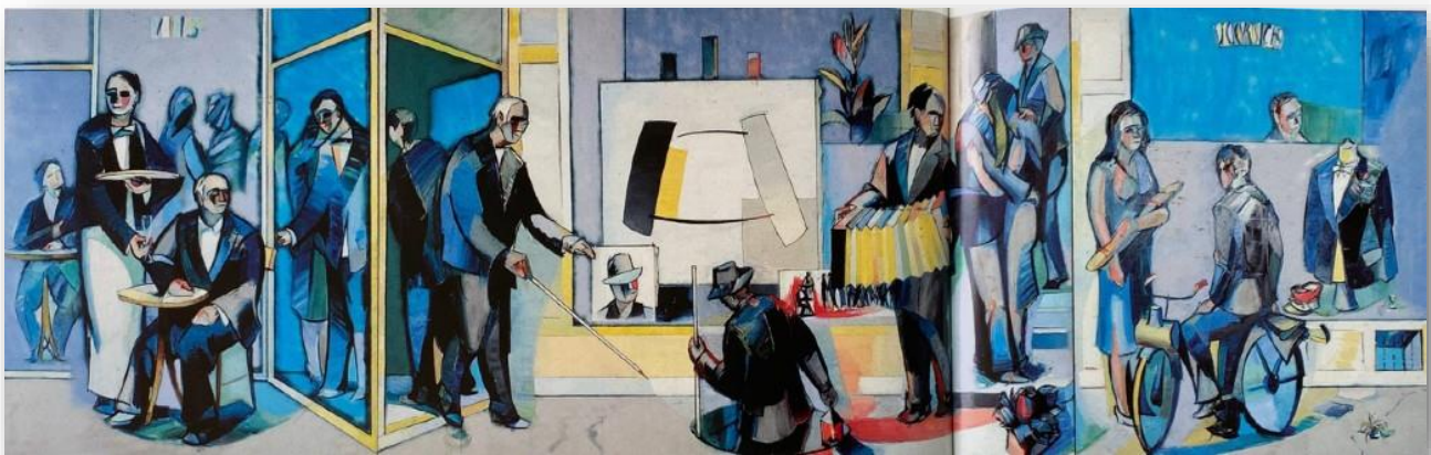
Jean HÉLION, Triptyque du Dragon , 1967

En mettant en lumière les interactions entre contextes sociopolitiques, innovations technologiques et préoccupations esthétiques, ce cycle de conférences vise à offrir une compréhension approfondie et nuancée de l'évolution des figurations et de ses codes au cours des six dernières décennies. Nous verrons notamment comment les artistes ont construit leurs tableaux en s'appropriant des récits et des images issus de la culture populaire (pub, bande dessinée, cinéma, média) pour critiquer les dérives de la société de consommation, la « société du spectacle » et les nouveaux moyens de communication.