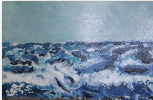
Œuvre de Gérard V Tous droits réservés- Expo Juin 2024