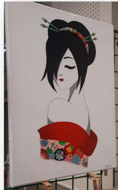
CŒuvre d'Amélia M. Tous droits réservés

Cette année nous travaillerons sur le thème du paysage et de sa représentation à partir des photos réalisées par Jean-Luc BOULARD des lieux remarquables de la ville de Sens ; monuments, jardins et autres lieux. Cette étude nous permettra d'aborder les techniques de perspective et de sa construction. En fin d'année, plusieurs séances sur site (sur le motif) seront prévues.