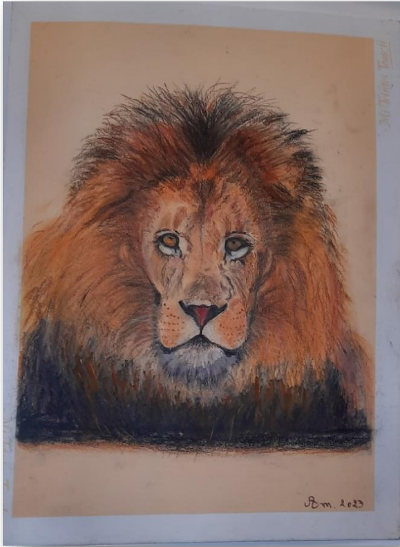
Oeuvre d'Annick M. Tous droits réservés