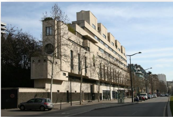
Le Paquebot, immeuble de Pierre Patout, Paris, 1934

En réaction aux lignes sinueuses de l'art nouveau, l'art déco s'internationalise autour de formes géométriques, lignes sobres et surfaces épurées.