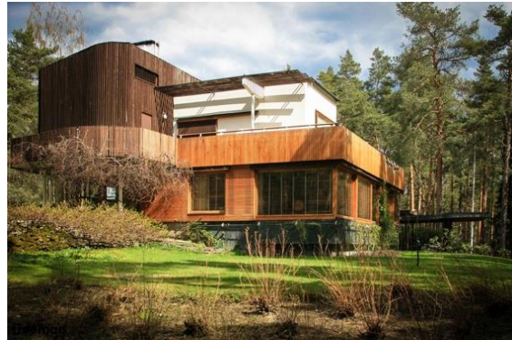
Villa Mairea Alvar Aalto, Noormarkku, 1938-1939

Bien après Antoni Gaudí en Catalogne, Frank Lloyd Wright, à l'origine du célèbre musée Guggenheim de New-York, a réfléchi toute sa vie à une architecture harmonieuse, ouverte sur son environnement, capable d'équilibrer ses espaces avec la nature, et innovante dans son emploi de matériaux naturels. Cette architecture médiatrice entre la nature, la technologie et les habitants permet d'ouvrir à l'œuvre d'Alvar Aalto en Finlande, visionnaire à la recherche d'une fluidité homme-nature.