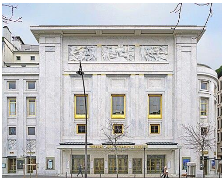
Théâtre des Champs Élysées, 1913