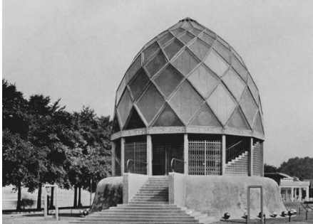
Palais de glace pour l'exposition du Werkbund, 1914