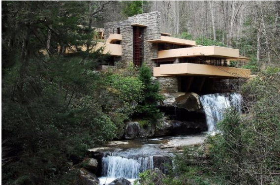
Fallingwater House, Frank Lloyd Wright, Pennsylvanie, 1935-1939