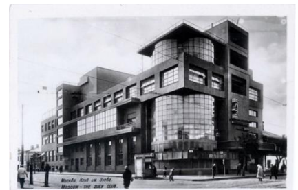
Club Zouïev, Moscou, Ilya Golosov, 1929

A l'aune des progrès techniques, les sociétés évoluent vers un idéalisme voulant amener l'homme vers un âge nouveau. En Allemagne, on propose des formes sinueuses ou très articulées au fort impact expressif, évoquant souvent la nature. Études de cas : Bruno Taut, Hans Poelzig, Erich Mendelsohn. En Italie, on glorifie la modernité par la civilisation urbaine, la vitesse et la machine : étude De La Citta Nuova de Sant'Elia (1914). En URSS, Vladimir Tatline développe sa vision n'allant « ni vers le nouveau, ni vers l'ancien, mais vers le nécessaire ». En effet, l'idéal des artistes constructivistes est de répondre aux besoins de la société communiste en utilisant technologies et ingénieries avancées.