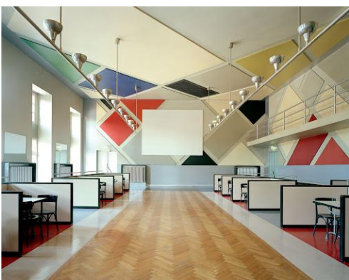
(Theo van Doesburg, L'Aubette, Strasbourg, 1926-1928)

En dialogue avec Piet Mondrian et Jean Arp, étude du néo-plasticisme architectural qui développe ses principes autour de la ligne et de la couleur pure pour une nouvelle plastique abstraite : Theo van Doesburg, Gerrit Rietveld, Mies Van der Rohe.