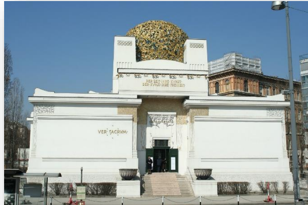
Pavillon de la Sécession, Joseph Maria Olbrich, Vienne, 1897

On clôt le chapitre architectural de l'art nouveau ( Jugendstil ) avec sa diffusion en Autriche. En dialogue avec Gustav Klimt, découvrons les réalisations architecturales de Josef Maria Olbrich, Josef Hoffmann, Otto Wagner et Adolf Loos.