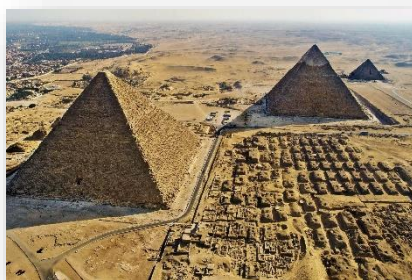
Pyramide de Kéops

Séance 8 mardi 17 décembre : La Nubie et Abou Simbel