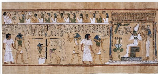
Papyrus « Le jugement des morts en présence d'Osiris » (Livre des morts)

Séance 4 mardi 12 novembre : Osiris, dieu des morts et des vivants