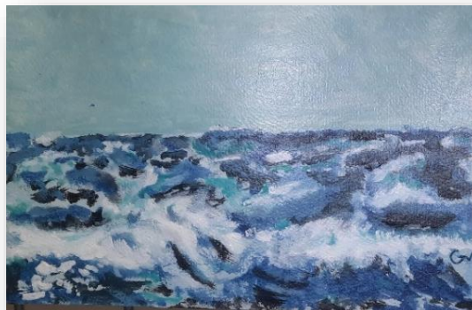
Œuvre de Gérard V Tous droits réservés- Expo Juin 2024