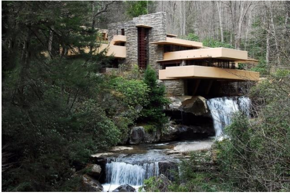
Fallingwater House, Frank Lloyd Wright, Pennsylvanie, 1935-1939