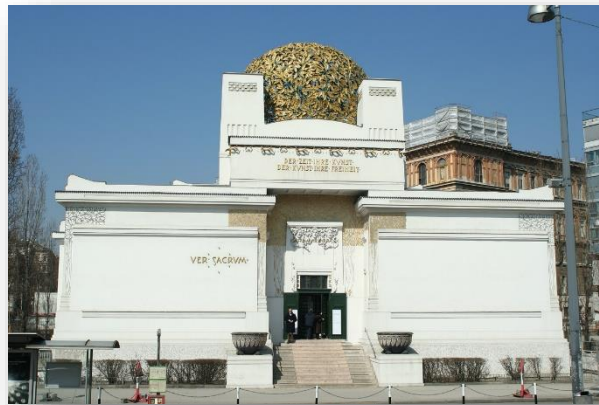
Pavillon de la Sécession, Joseph Maria Olbrich, Vienne, 1897

On clôt le chapitre architectural de l'art nouveau ( Jugendstil ) avec sa diffusion en Autriche. En dialogue avec Gustav Klimt, découvrons les réalisations architecturales de Josef Maria Olbrich, Josef Hoffmann et Otto Wagner.