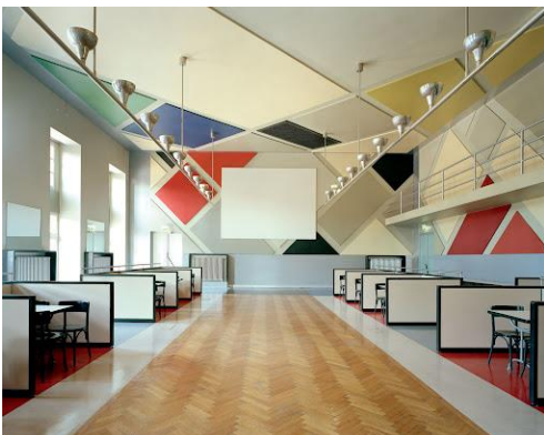
(Theo van Doesburg, L'Aubette, Strasbourg, 1926-1928)

En dialogue avec Piet Mondrian et Jean Arp, étude du néo-plasticisme architectural qui développe ses principes autour de la ligne et de la couleur pure pour une nouvelle plastique abstraite : Theo van Doesburg, Gerrit Rietveld, Mies Van der Rohe.