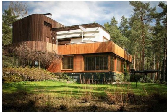
Villa Mairea Alvar Aalto, Noormarkku, 1938-1939

Bien après Antoni Gaudí en Catalogne, Frank Lloyd Wright, à l'origine du célèbre musée Guggenheim de New-York, a réfléchi toute sa vie à une architecture harmonieuse, ouverte sur son environnement, capable d'équilibrer ses espaces avec la nature, et innovante dans son emploi de matériaux naturels. Cette architecture médiatrice entre la nature, la technologie et les habitants permet d'ouvrir à l'œuvre d'Alvar Aalto en Finlande, visionnaire à la recherche d'une fluidité homme-nature.