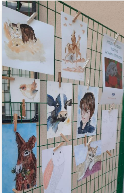
Exposition des travaux des élèves de l'atelier dessin-peinture 14 et 15 juin 2024 aux Espaces culturels Savinien - Sens