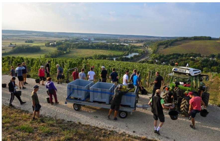
Vendange au Clos des Sénons

Désormais, en 2024, ce sera pour le domaine la 3 ème année de récolte. L'an dernier, ils ont produit 40 000 bouteilles.