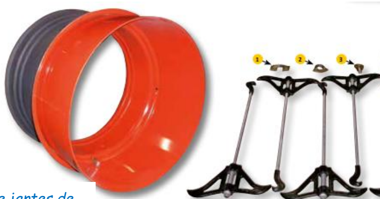
Production de jantes de tracteurs chez ERMAS

L'entreprise ERMAS ou Etudes et Réalisations de Machines Agricoles Spéciales s'est spécialisée dans une véritable niche dans le monde agricole : la fabrication de jantes de tracteurs. Au premier coup d'œil, on peut être impressionné par la taille des locaux d'ERMAS qui travaille des pièces de grandes dimensions mais c'est une structure à taille humaine avec 25 employés. Si les jantes sont fabriquées de A à Z dans l'usine à Soucy, les clients d'Ermas, eux, sont dans toute la France. Le plus important pour Maxime Serdin, gérant de l'entreprise c'est de s'adapter à tous ses clients, en fonction également des sols et des régions.